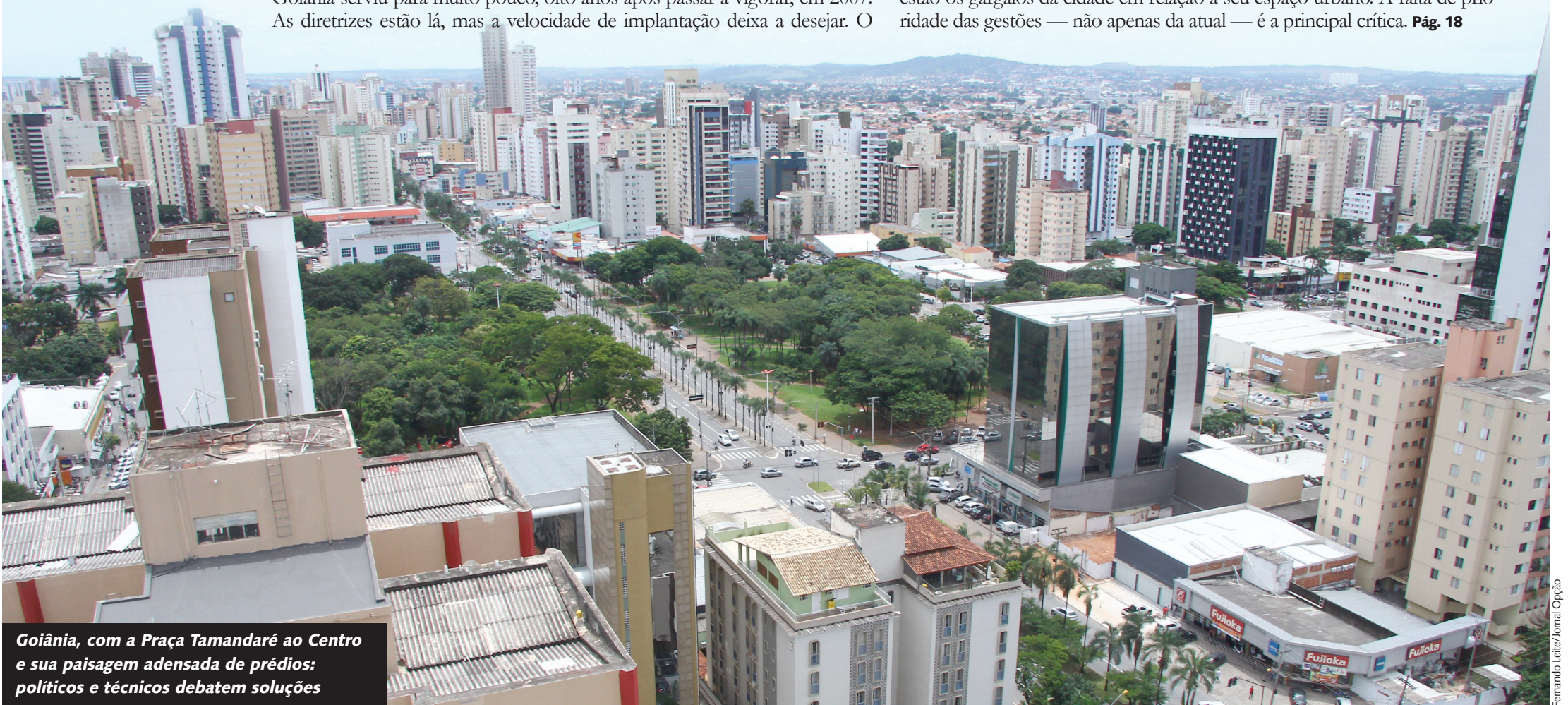
Goiânia, com a Praça Tamararé ao Centro e sua paisagem adensada de prédios: políticos e técnicos debatem soluções

Jornal Opção convidou agentes políticos e técnicos para apontar onde estão os gargalos da cidade em relação a seu espaço urbano. A falta de prioridade das gestões — não apenas da atual — é a principal crítica. Pág. 18